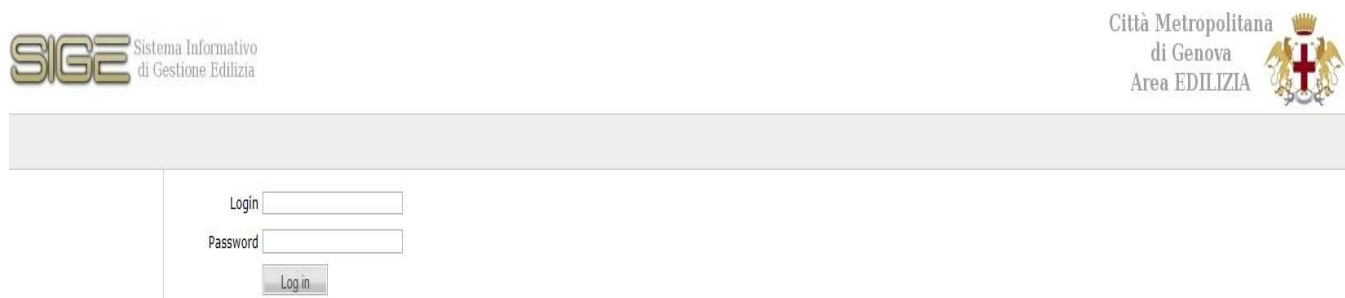
Fig. 1-Profilazione utente