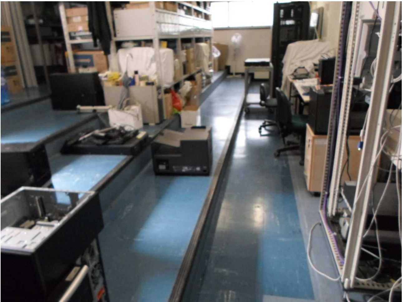
Sala server ist. Cassini, piano primo, pavimentazione in vinilamianto blu