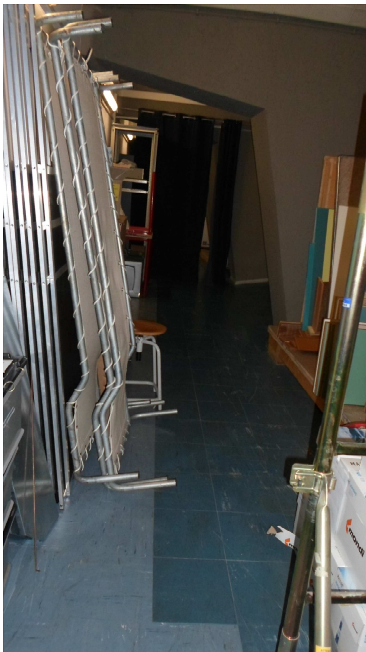
Deposito (ex anello aula magna) ist. Cassini, piano primo, pavimentazione in vinilamianto blu