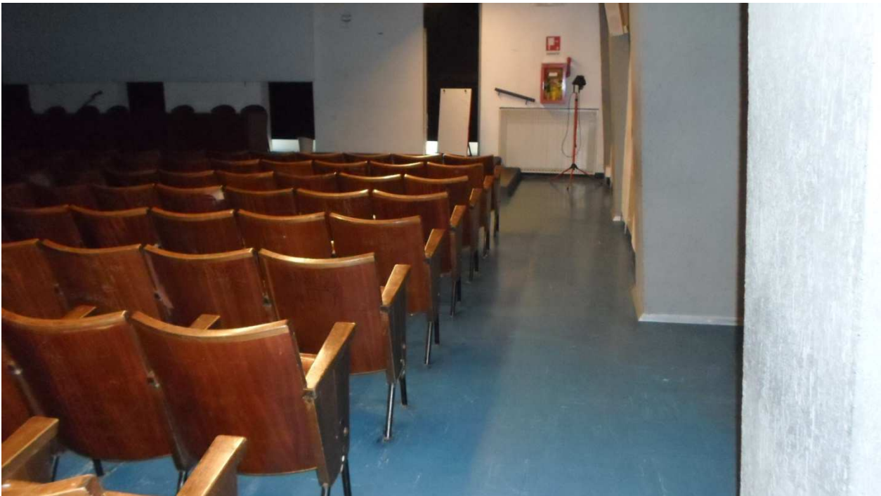
Aula magna ist. Cassini, piano terra, pavimentazione in vinilamianto blu