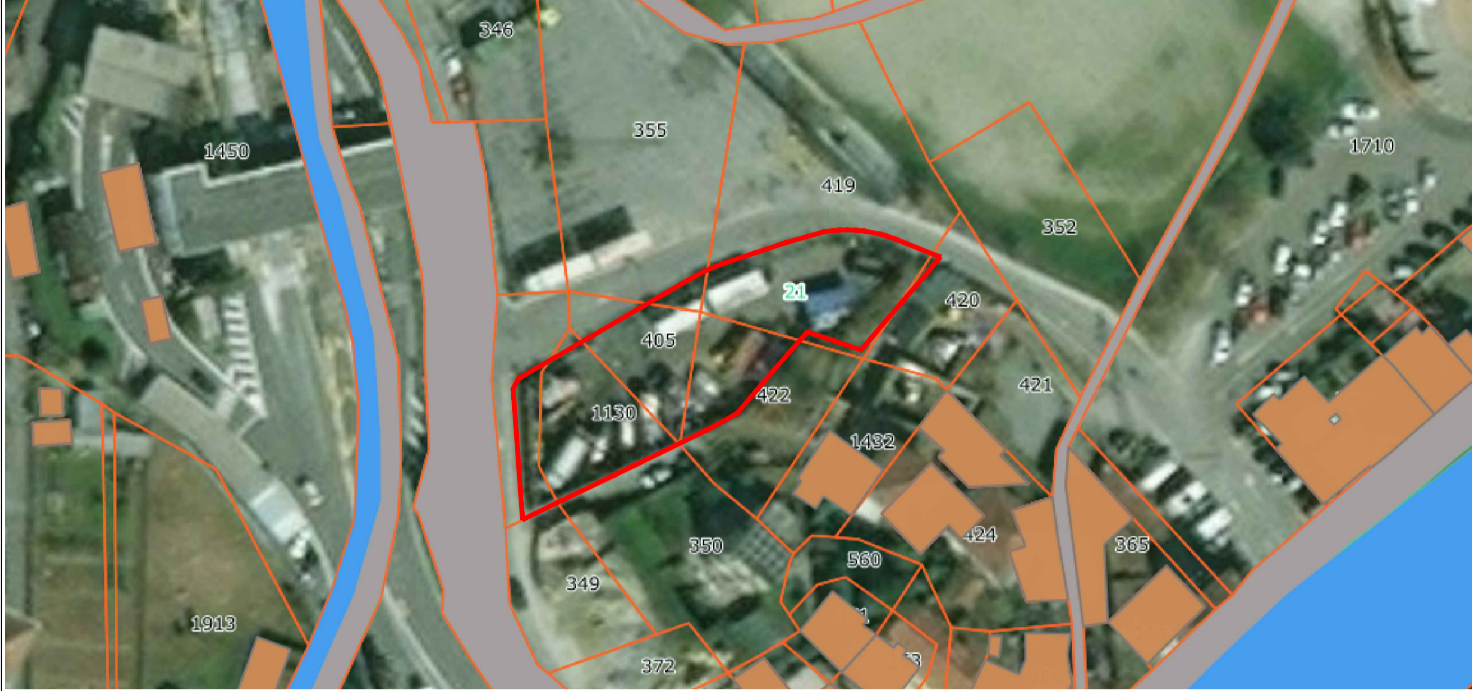
INDIVIDUAZIONE CATASTALE DEL SITO (Catasto terreni di Rapallo, Foglio 21)