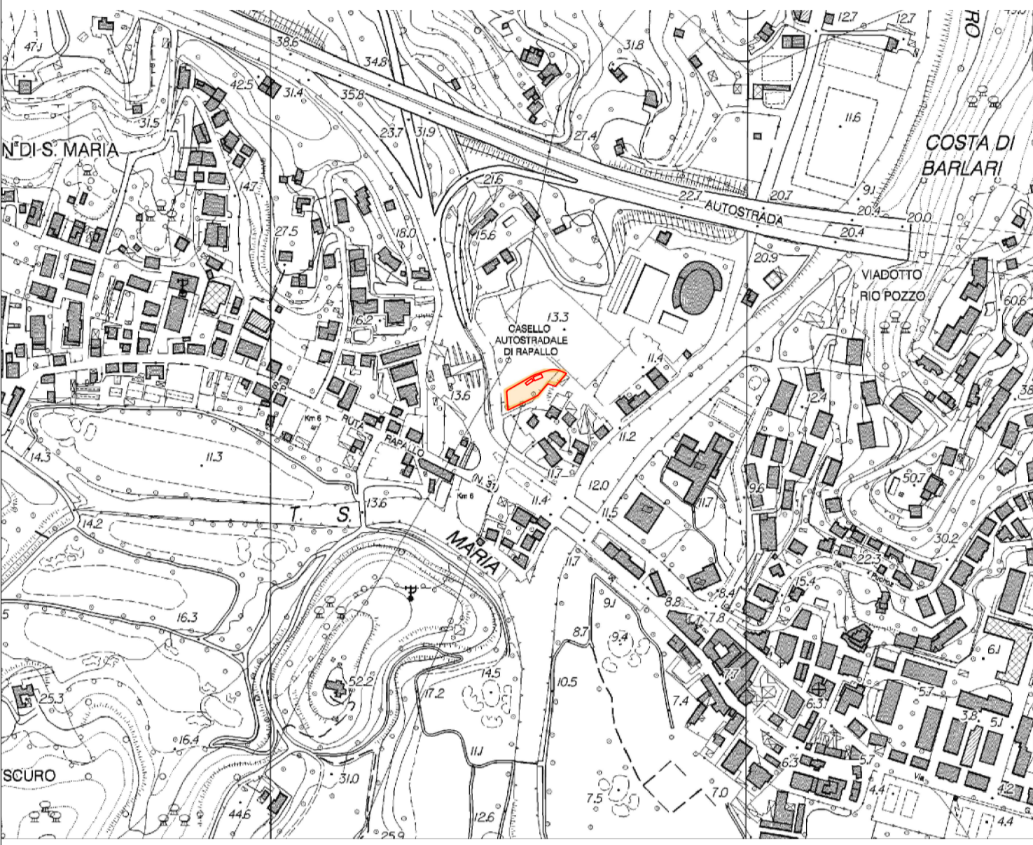
INDIVIDUAZIONE DEL SITO SU CARTA BASE REGIONALE - Scala 1:5.000