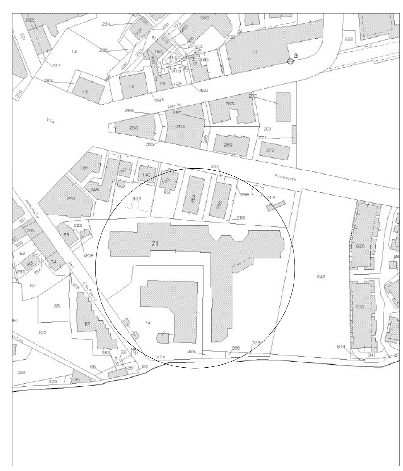
Stralcio Planimetrica Catastale 1:2000