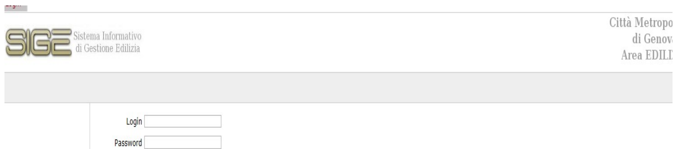
Fig. 1-Profilazione utente